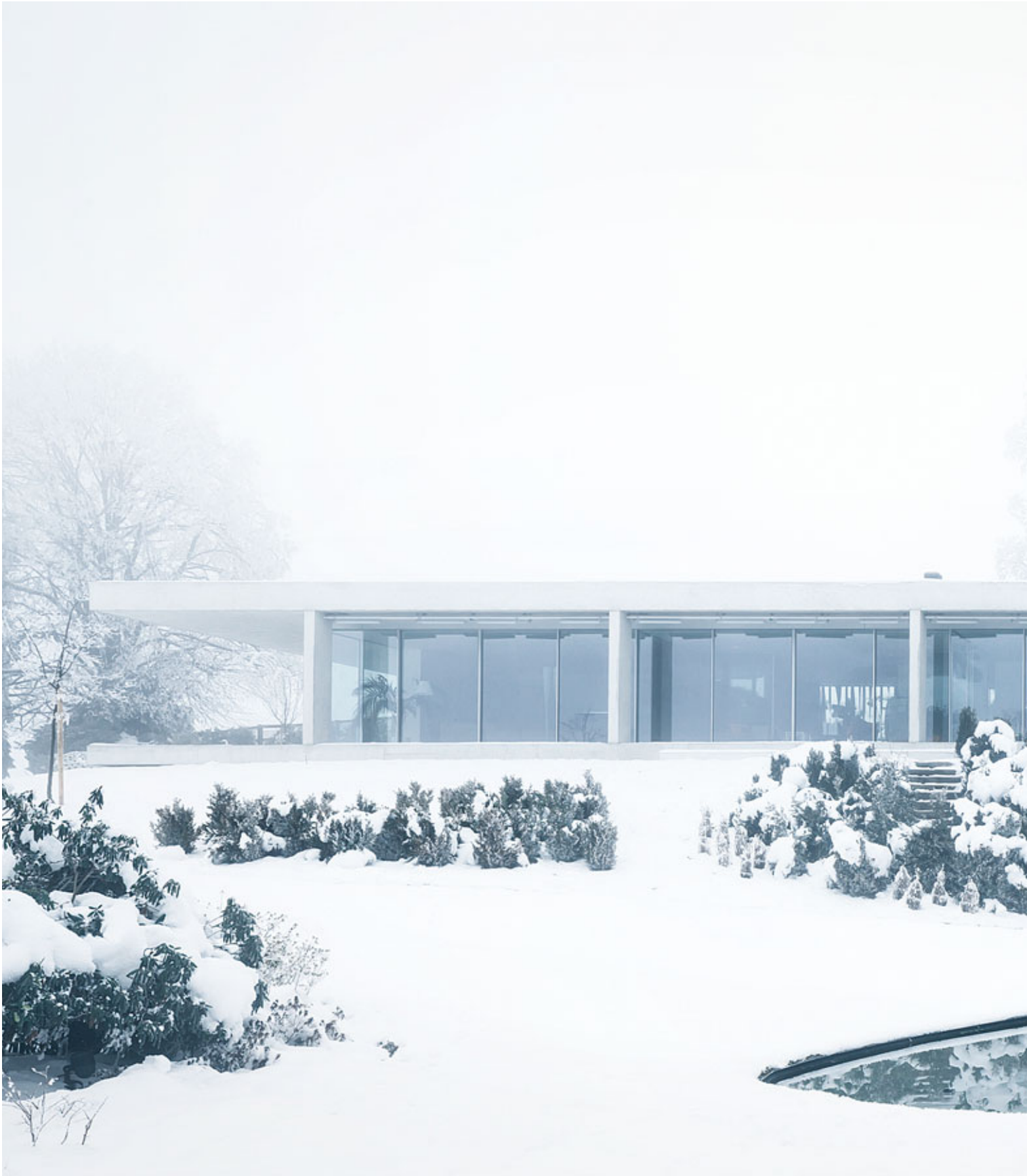
Villa in Appenzell, Switzerland. Architecture: Peter Kunz, Switzerland. 2010