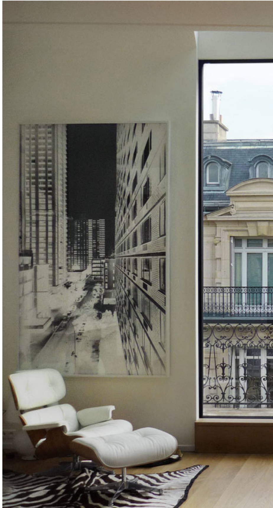
Renovation in Paris, France. Architecture: Etienne Herpin, France. 2009.