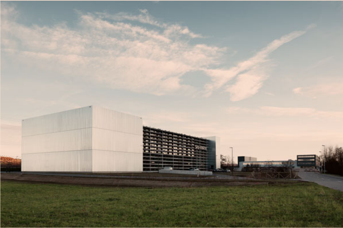
Sky-Frame Headquarters in Frauenfeld, Switzerland.