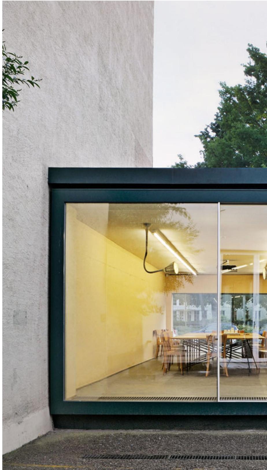
Herzog & De Meuron, Switzerland. Architecture: Herzog & de Meuron, Switzerland. 2008