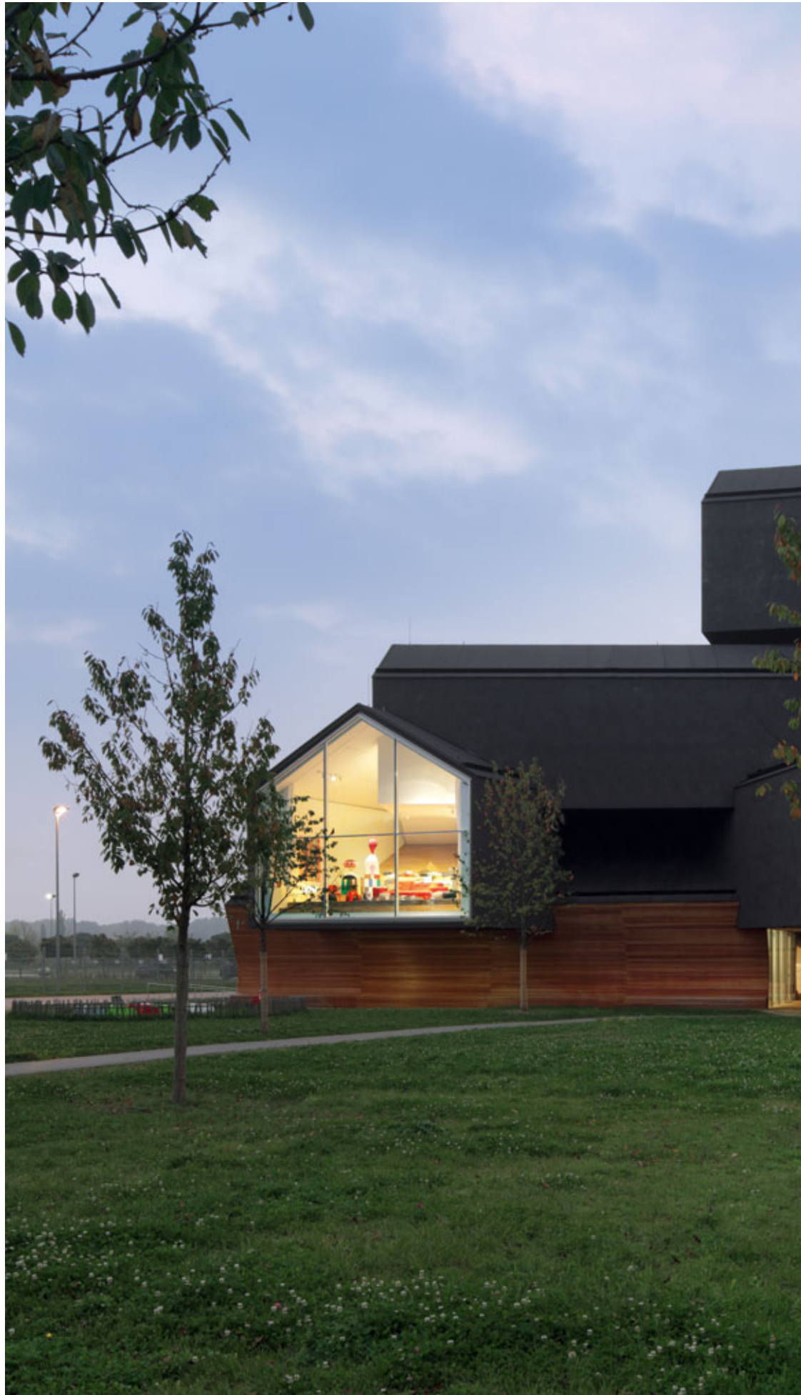
VitraHaus, Germany. Architecture: Herzog & de Meuron, Switzerland. 2010