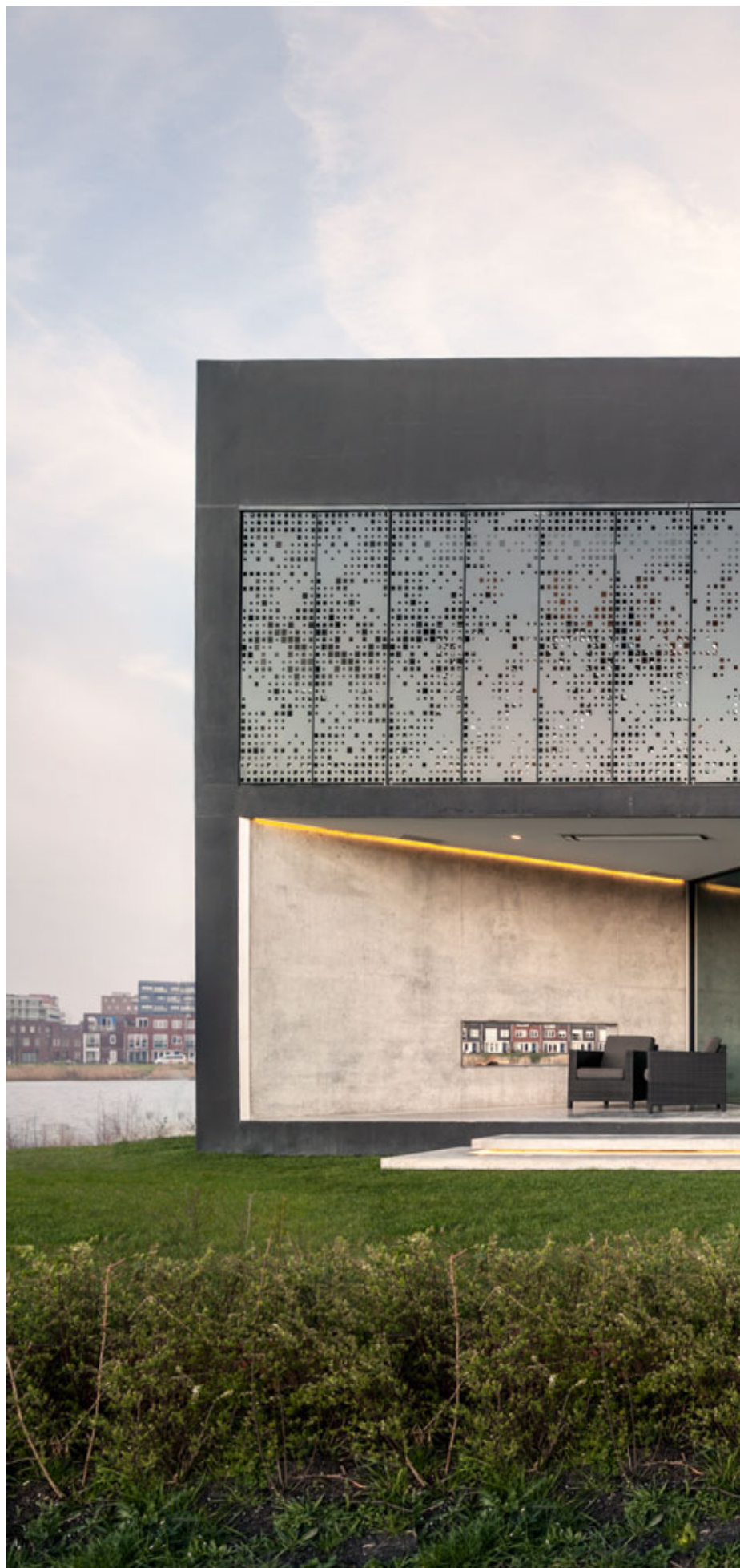
Villa Kavel 01, Netherlands. Architecture: Studioninedots, Netherlands. 2013