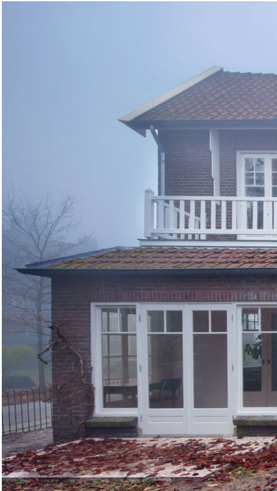
Villa in Utrecht, Netherlands.

Architecture: Zecc Architects BV, Netherlands. 2010