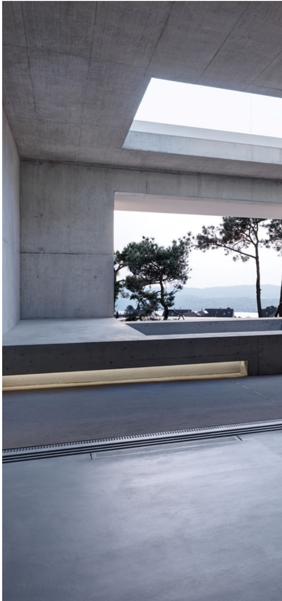
2 verandas, Switzerland. Architecture: Gus Wüstemann, Switzerland, Spain. 2012