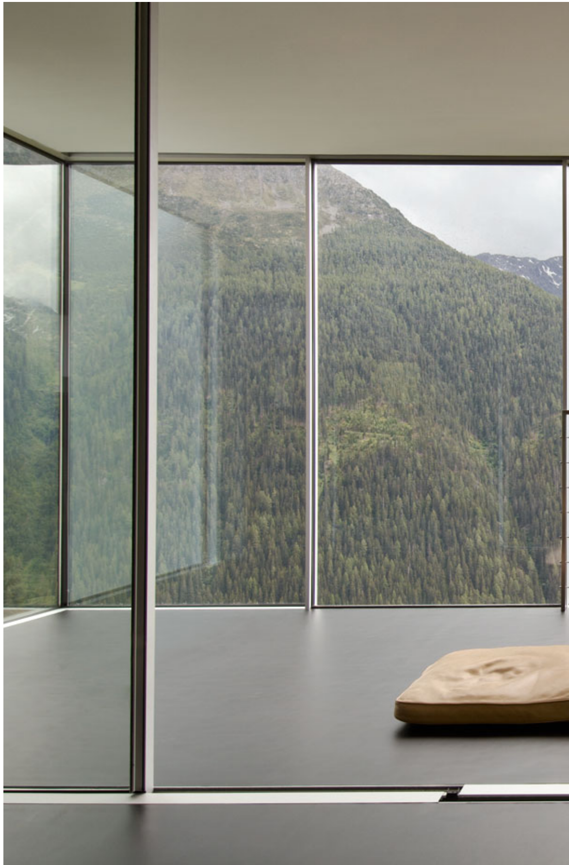
House in Guarda, Switzerland. Architecture: Roger Vulpi, Switzerland. 2006