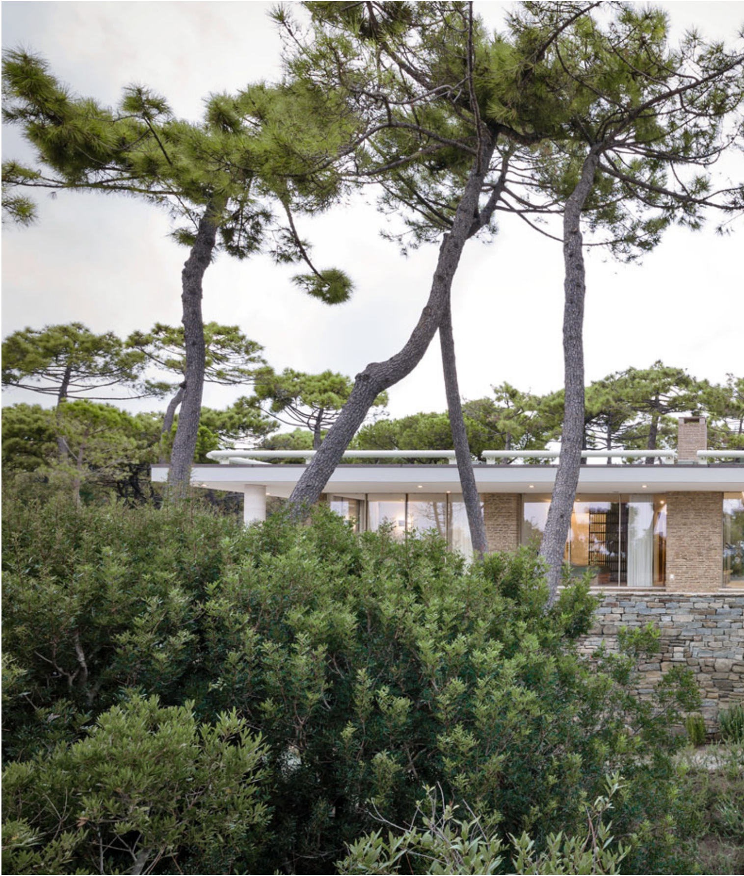
House in Roccamare, Italy.

Architecture: Architectures Générales, Sergio Cavero, Switzerland. 2015